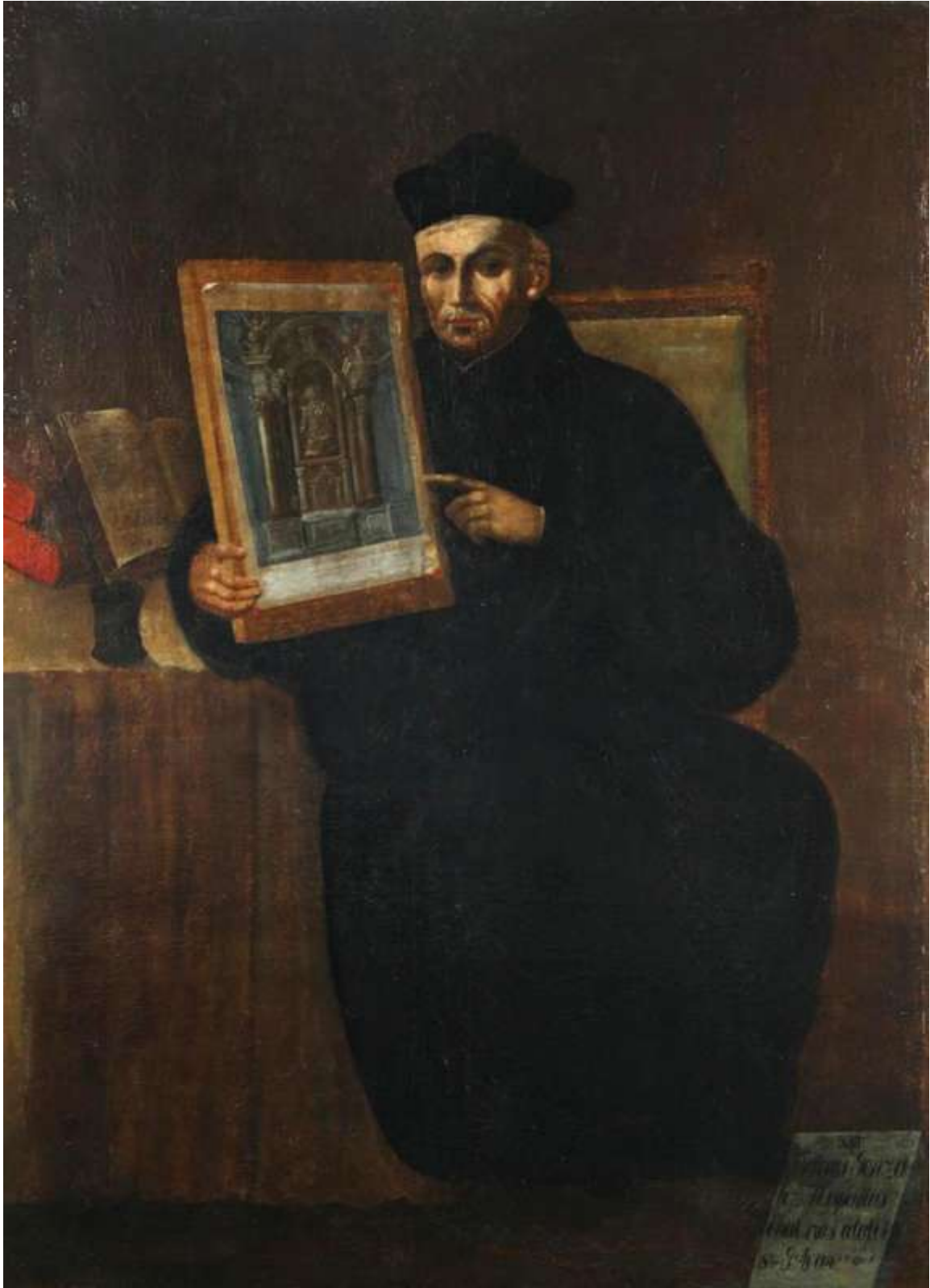
A restaurált kép