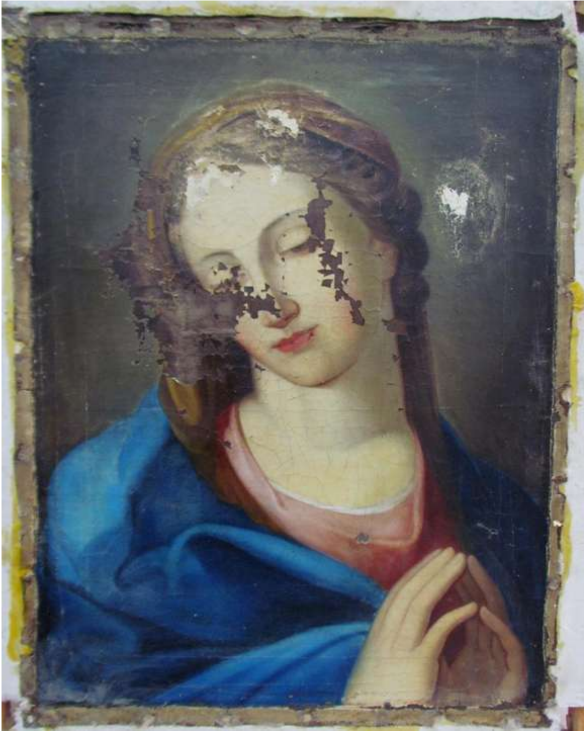
Konzervált, feltárt állapot