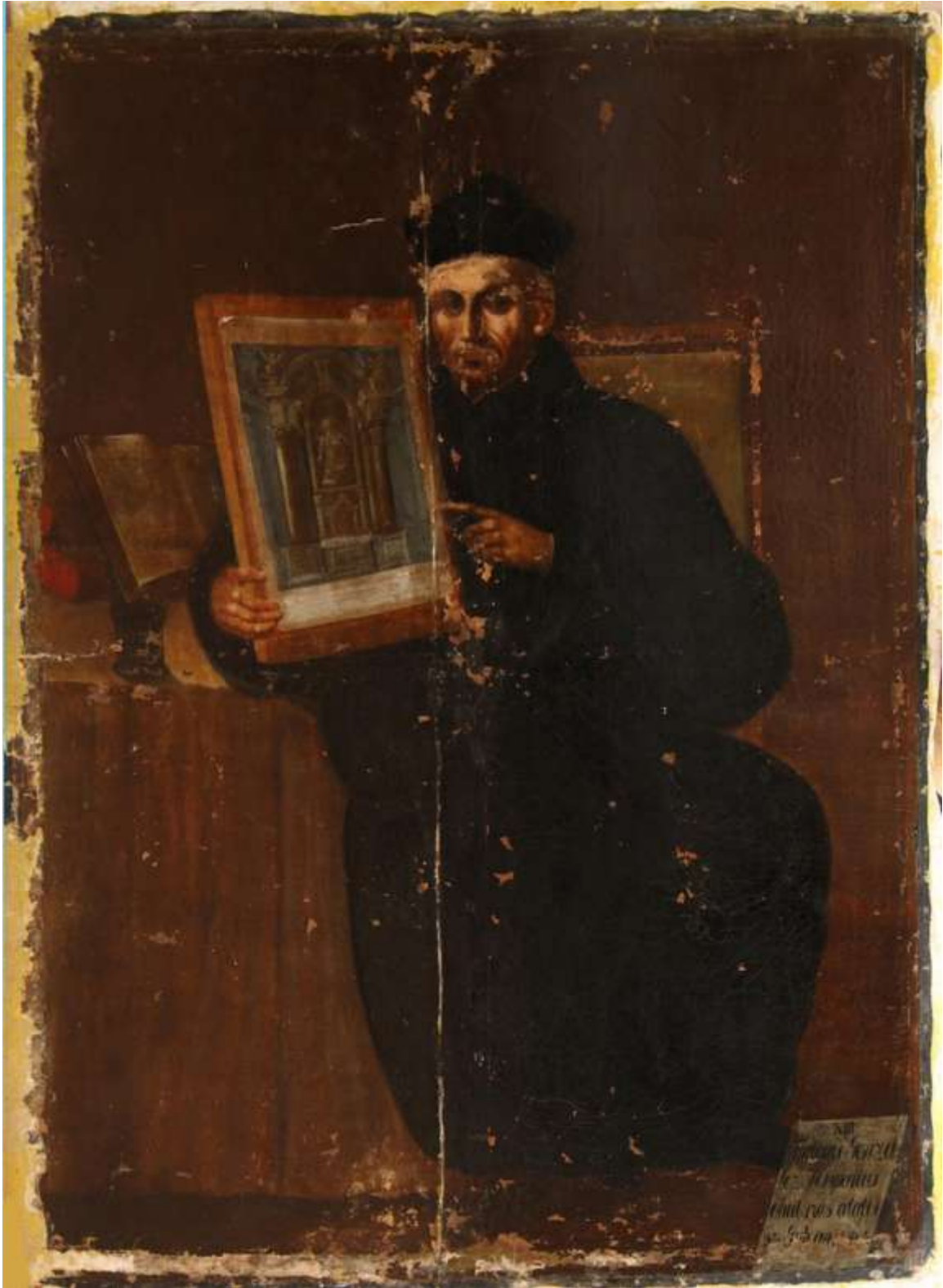
Konzervált, feltárt állapot