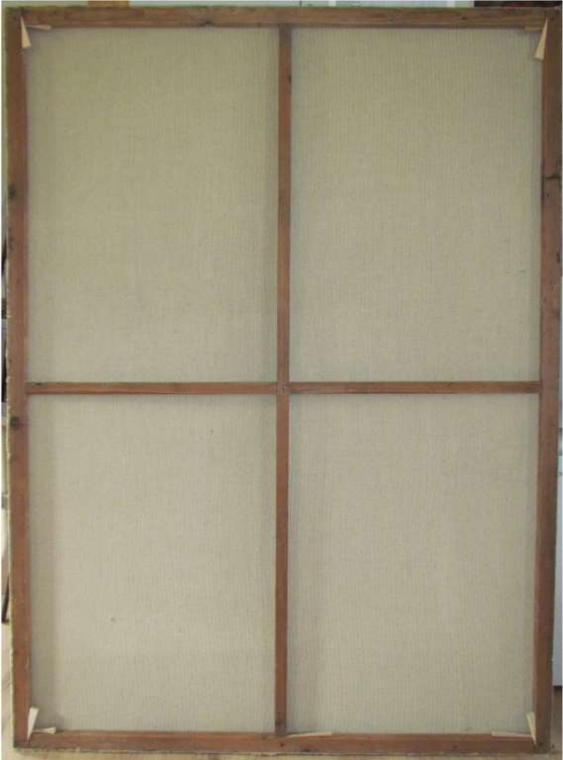
A restaurált kép hátoldala