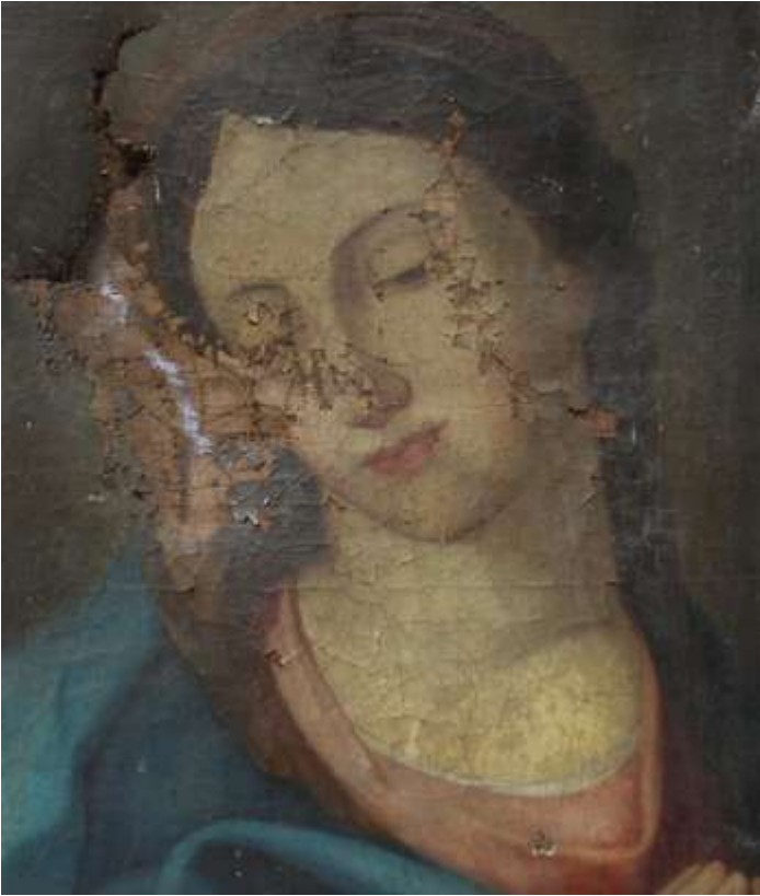
Átvételi állapot, részlet