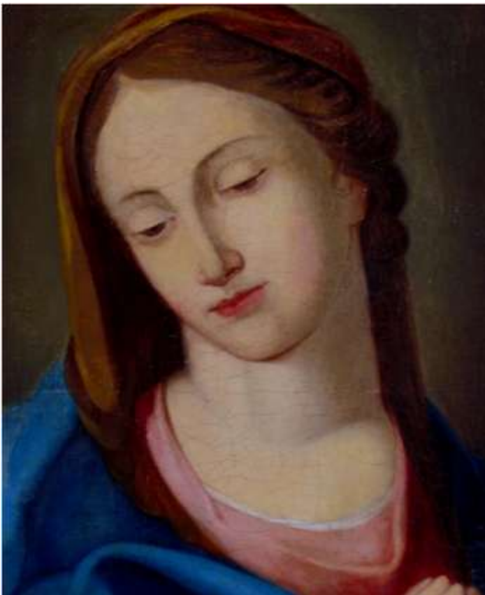
Kész állapot, részlet