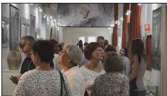
A kiállítás megnyitó képei