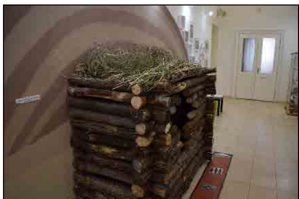
Fotók a kiálltásról