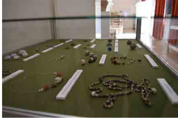
Fotók a kiállításról