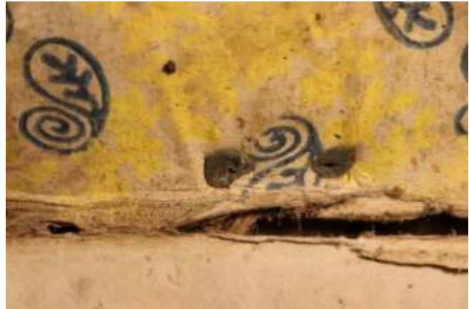
A fémborításon megjelenő kis szegecsvég és a szegecs előzéktükrön megjelenő másik vége, ami ellapult nagy korongként jelenik meg

A táblákhoz a fémborítást fémszegecsekkel rögzítették az előzéktükröt áttörve. A rögzítéshez rézszalagból csavart tölcsér alakú szegecset használtak, melynek hegye a tábla külső fémborításán jelenik meg, ellapított vége az előzéktükrön.