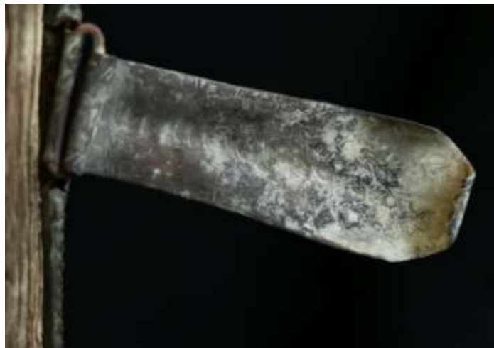
A csat elő és hátoldala, a csat egyrétegű, sárgaréz lemezből készült, feltehetően jóval a fémborítás készítése után került a kötésre