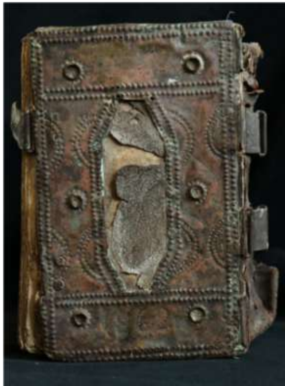
A kötet háttáblája