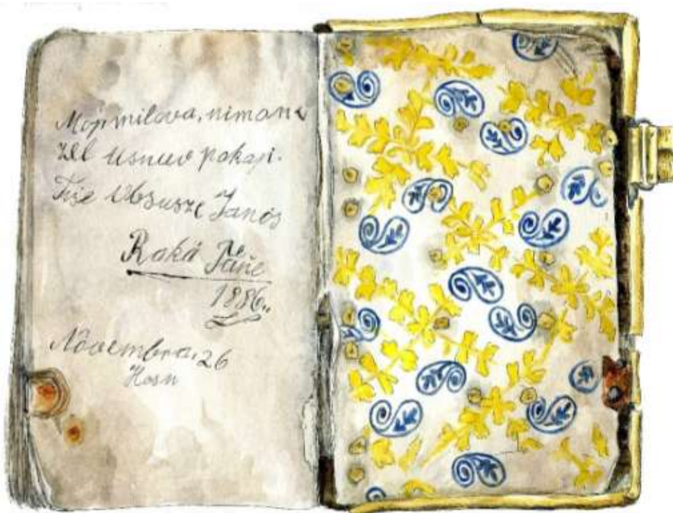
A két dúcról, két színnel nyomott előlék

Az előzékek szerkezete bizonytalan, a táblák előléktükrére dúcnyomásos papír volt kiragasztva, de dúcnyomásos röplap sem elől, sem hátul nem volt. Az első íven megfigyelhető volt az előlék áthajtása, az áthajtás széle hajtott lappárra utalt. Ez alapján feltételezhető, hogy a dúcnyomásos röplap elveszett. Az áthajtás kb. 5mm, és mindkét közrefogó ívhez hozzáragasztották. A fémborítás felszerelésekor a dúcnyomásos előléktükröket a szegecsek áttörték. A kötet elején a dúcnyomásos előléktükrökre sárgásfehér lapot ragasztottak. Ennek széle, úgy tűnt, hogy szintén áthajtott volt, de a lap sérülése miatt ez bizonytalan. Kiragasztása a fémborítás felszerelése után a történt, mert a szegecsek nem törtek át.