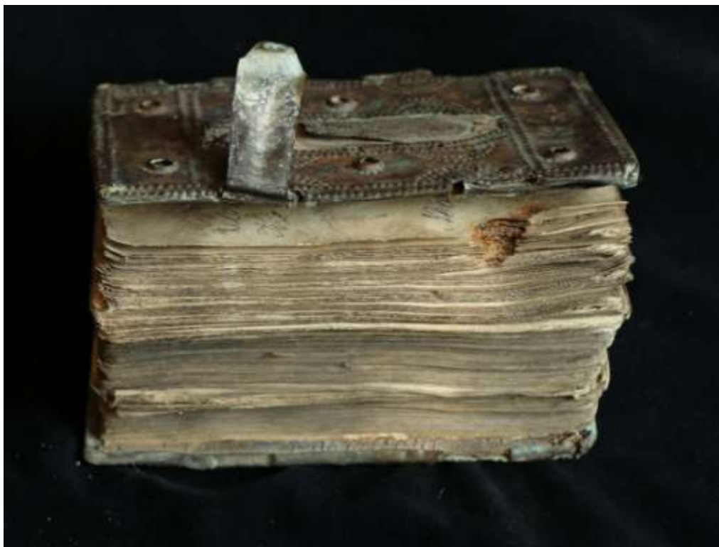
A sérült, kopott hosszmetzés