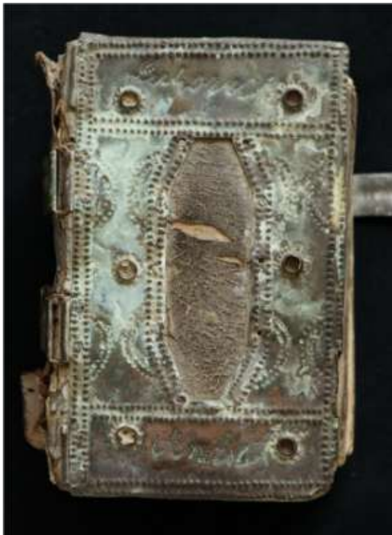
A kötet előtáblája