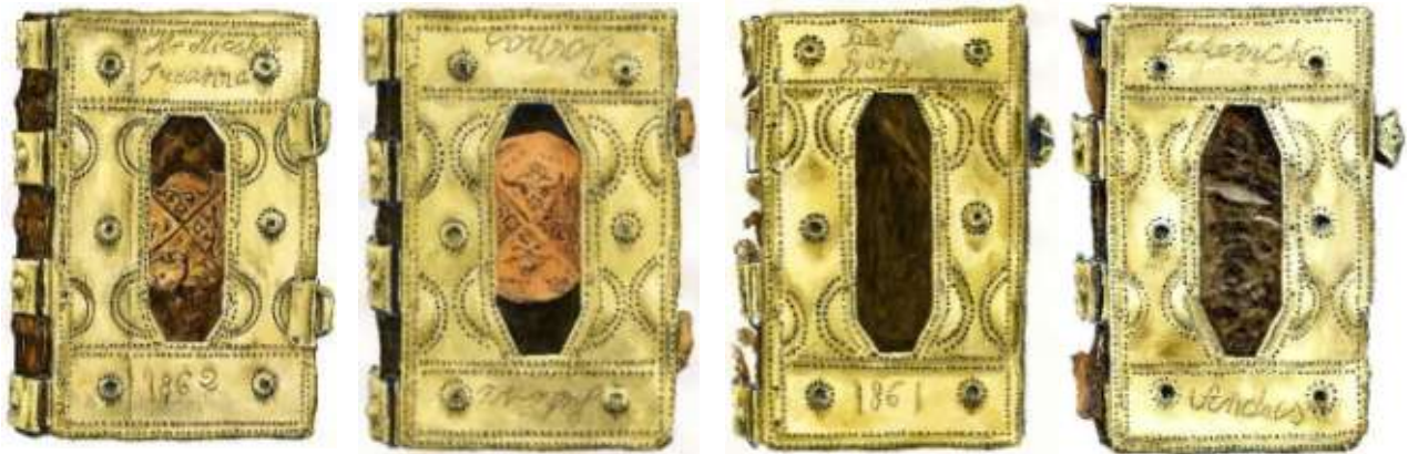
Pest 1856, Magántulajdon