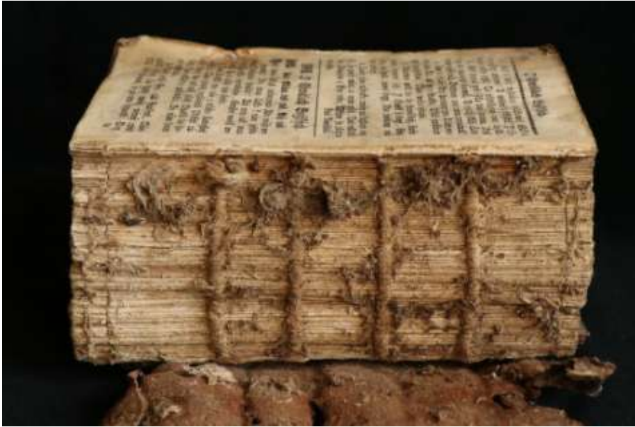
A négy szimpla bordára fűzött könyvtest

A könyv íveit négy szimpla zsinigbordára, váltva fűzték fel, fitzponttal. A fűzéspontokon az íveket bemetszették. A bemetszések ellenére a fitzpont öltéssora lábnál nem ebben a vonalban fut. A gerincen nem volt gerinckasírozás.