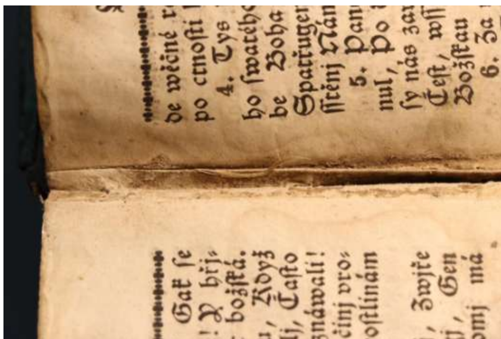
Az előzők áthajtása az első íven