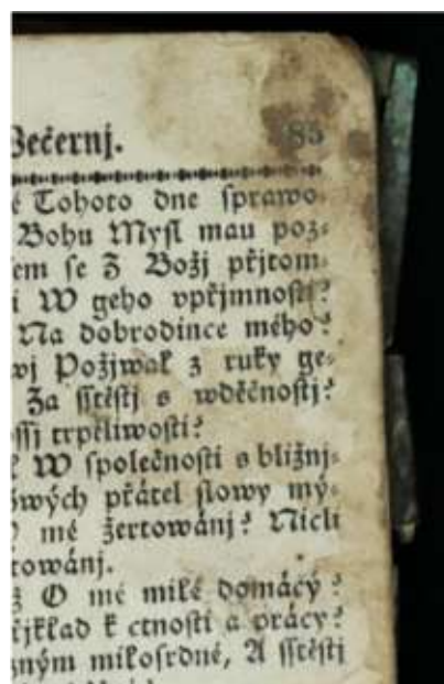
Szennyeződések a lapokon