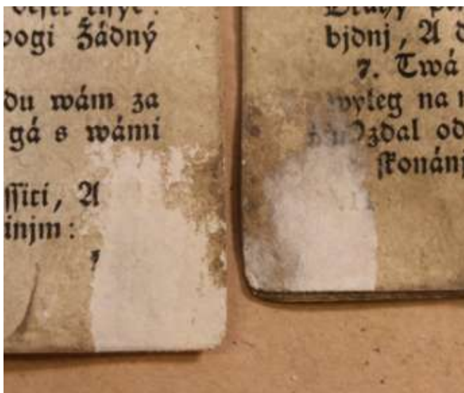
Összetapadt és korábban széthúzott lapok