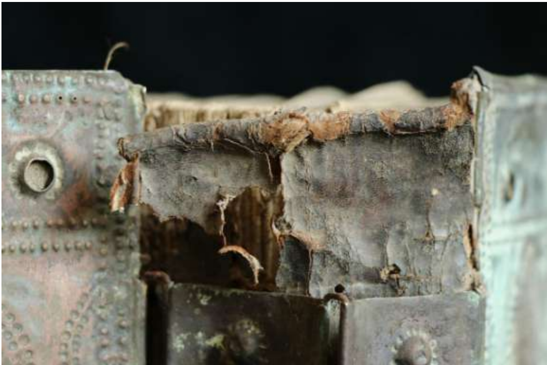
A leszakadt sapkarész