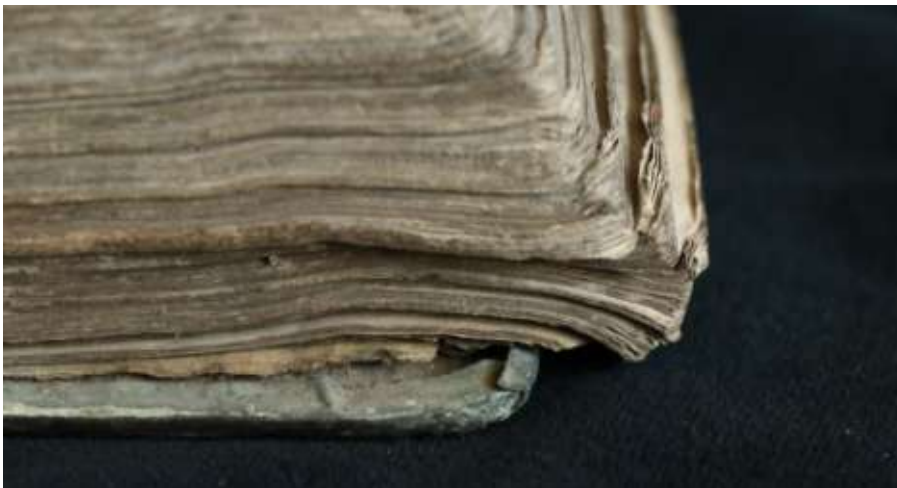
A kötésből kimozdult ívek