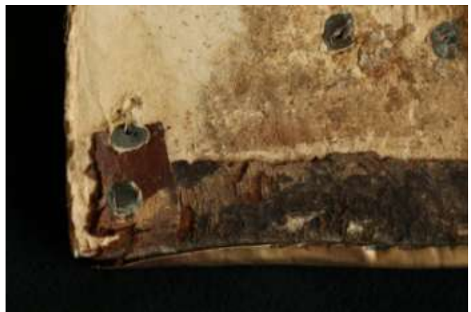
Az új vörösbarna gerincbőr, ami ráborul az eredeti beütésre. A gerincbőr cseréje után történt a fémborítás táblára szegecselése, ezt igazolják a beütéseket átütő szegecsek