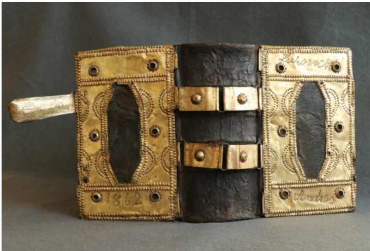
A könyv gerinc felől nézve