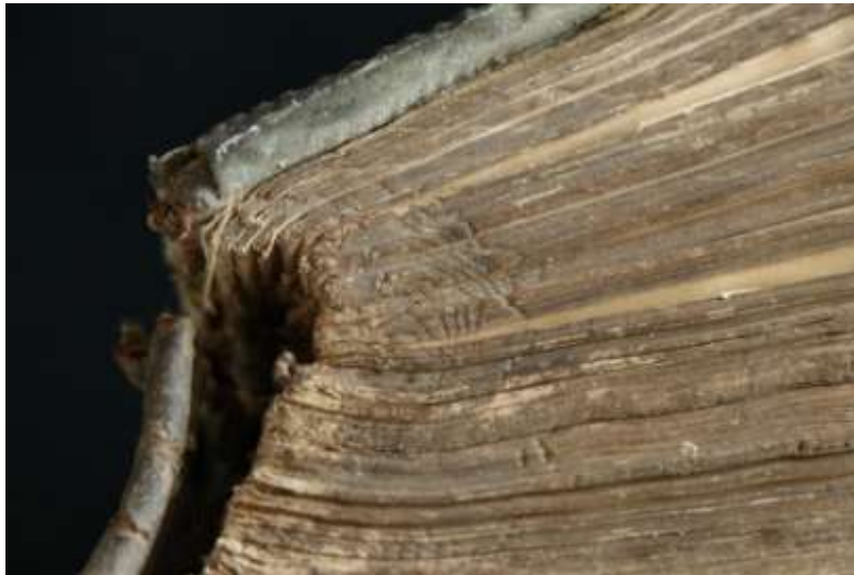
Poncolás nyoma a metszésen

A metszések barnás színűek, eredetileg feltehetően zöldek voltak. Mindhárom metszésen poncolás nyoma fedezhető fel. A poncolás az eredeti, fémborítás nélküli, kötés része volt.