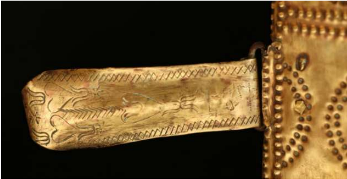
A csaton kirajzolódó 1874-es évszám melynek utolsó számjegyét a fémgűrűre hajtották