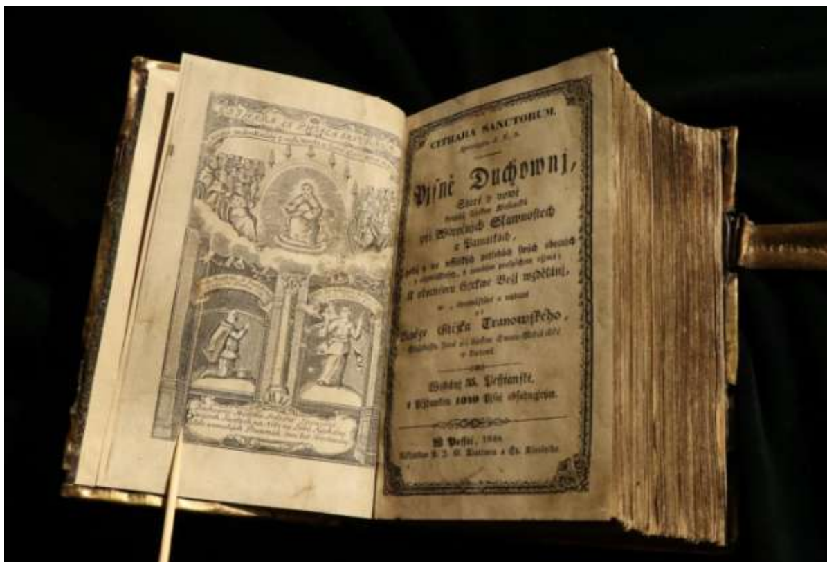
A pótló címlap a vele szembe forduló metszettel