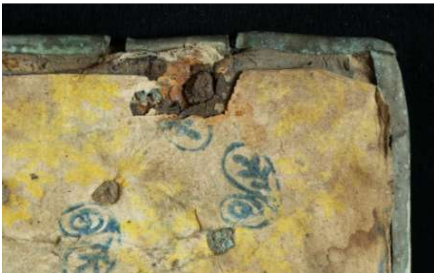
A csatot rögzítő korrodált kovácsoltvas szög

A hiányok és a sérülések miatt a könyvtest eldeformálódott. A kötet elején az előzéktükrön penészfoltok jelentek meg, a kötet nyílása kiszakadt az előzékek szerkezete felismerhetetlenné vált.