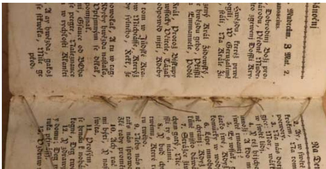
A többszörös fűzés öltései (a szálak már a kötet szétbontáshoz felvágva)

A könyv fűzése több helyen elszakadt az ívek elmozdultak, ezért szélük megkopott a sarkok, sok helyen visszahajlottak. A megbomlott fűzést több helyen ráfűzéssel próbálták megjavítani, ezekben az ívekben a fűzőszálak többszöröződtek.