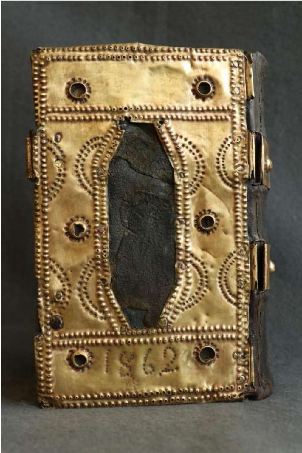
A könyv háta