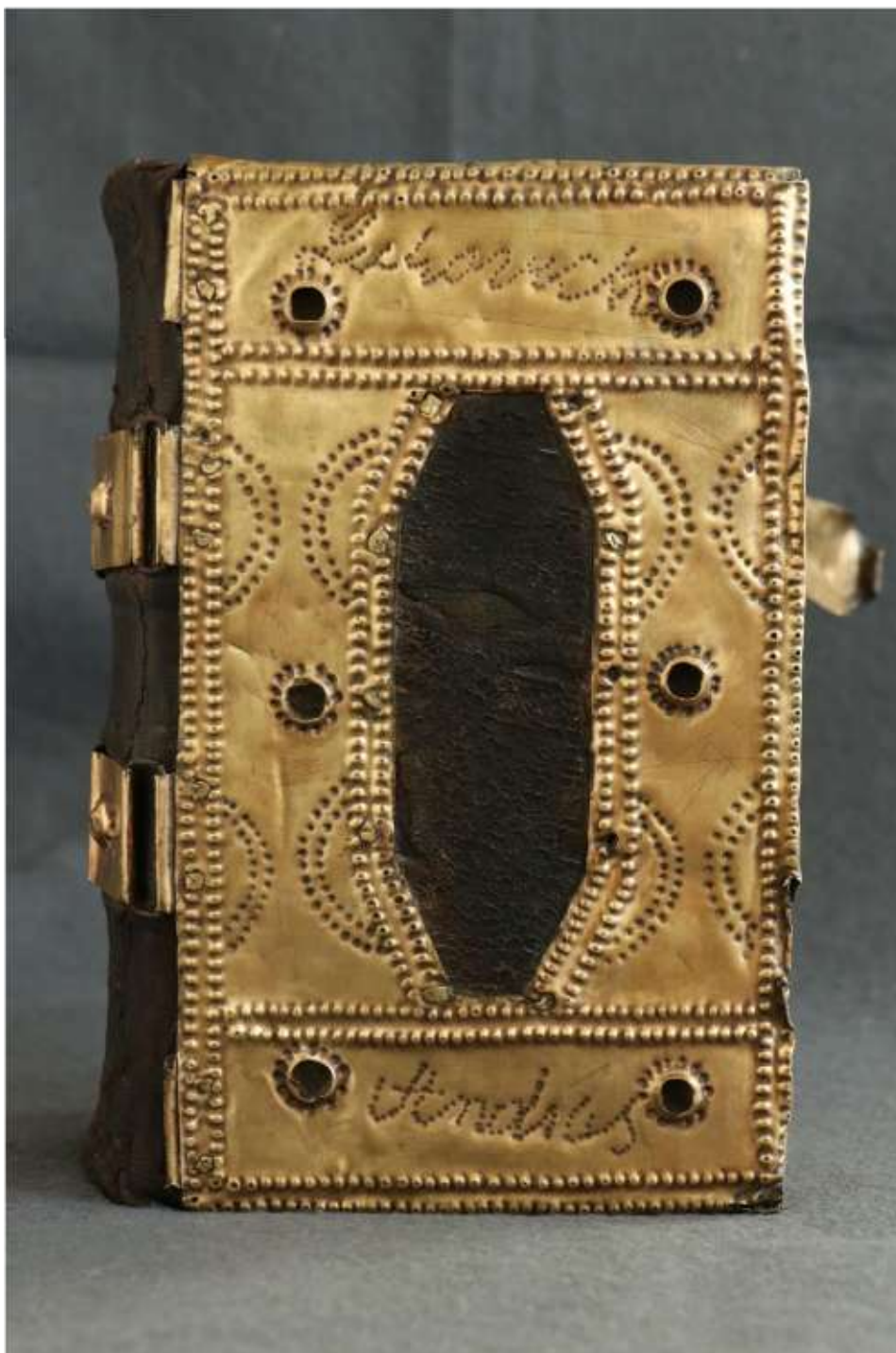
A kötet előnézete