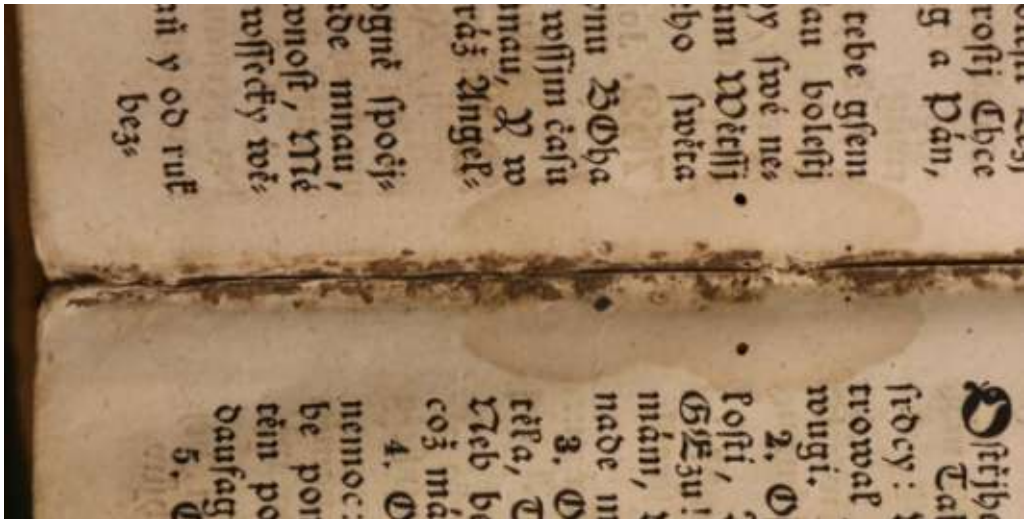
A lapok hajtságában felhalmozódott szennyeződések