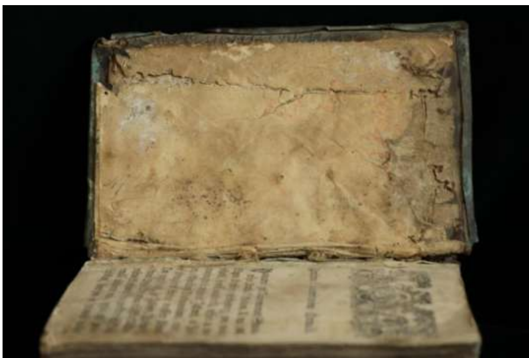
A dúcnymásos előzőkre kiragasztott megsárgult előzőklap, lábánál keskeny sávban kilóg alóla a dúcnymásos előzők széle

A kötet végén kézirásos lappárt találunk, melynek egyik levelét kitépték, anyaga eltér a nyomtatvány és az elől kiragasztott előzők papírjától. A sérülések miatt kapcsolódása a kötethez pontosan nem volt meghatározható.