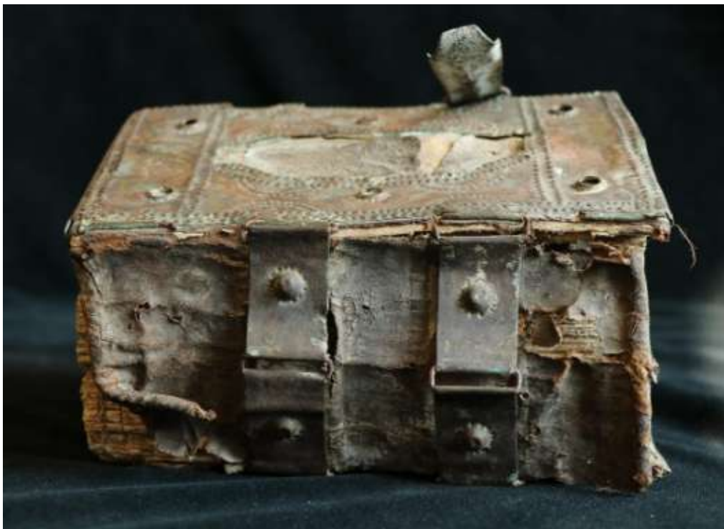
A könyv gerince a fémpántokkal

A kötetek sorába szépen illeszkedik a restaurált kötet. Készítője gyakorlatlan kezekkel írta vagy másolta a fémborításra a szöveget, ez utóbbira utal a második kötet fejjel lefelé megjelenő felirata, ami úgy tűnik, sem a készítőt, sem a megrendelőt nem zavarta. A köteteken, ahol felirat tájékoztat erről, a készítési idők is közel esnek egymáshoz.