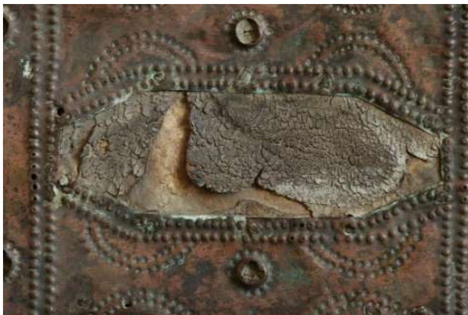
A háttábla részlete a hiányos zsugorodott bőrborítással, az átkopott domborítással és a kiszakadt szegecsekkel

A fémborítás kivágása alól kilátszó eredeti kötésbőr összezsugorodott, barkázata cserepessé és töredékessé vált, a könyv beütései részben elpusztultak.