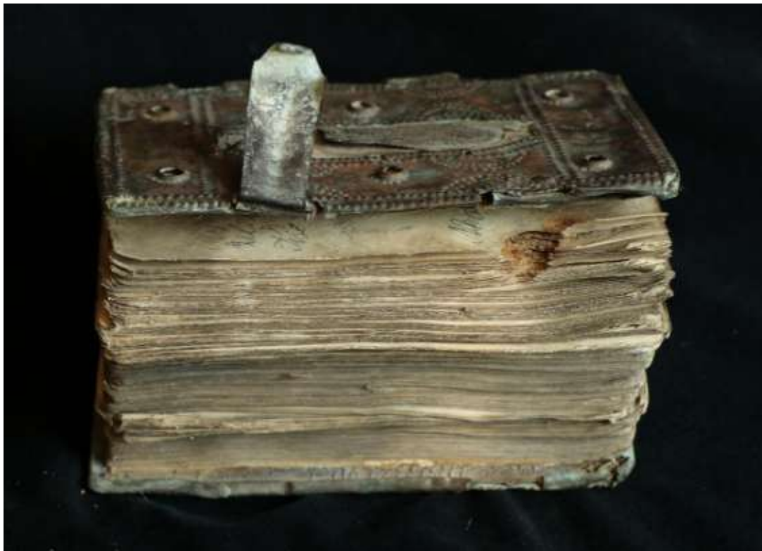
A kötet hosszmeteszése a fennmaradt csattal