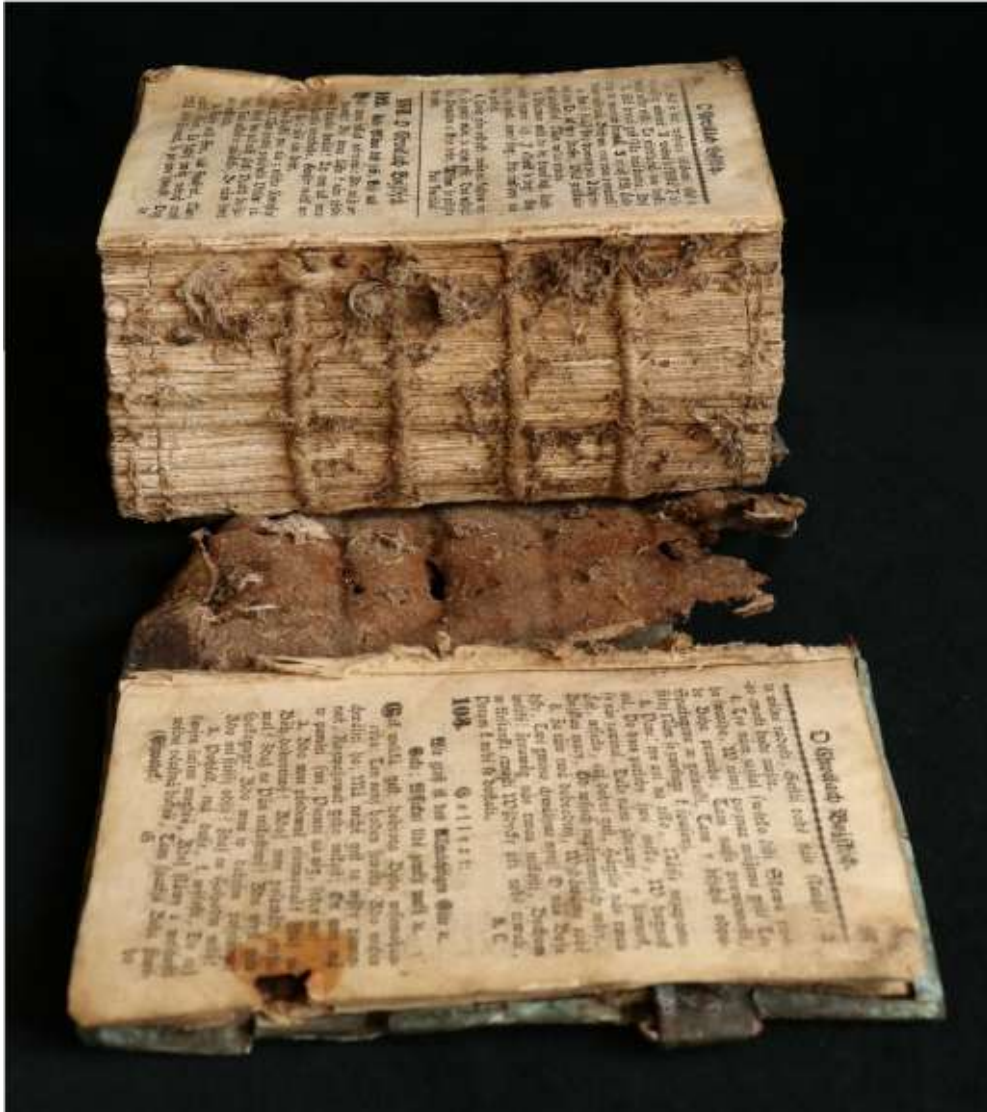
A sérült és szennyezett könyvttest félig kiszakadt a kötéséből

A gerinc enyvezését a penész lebontotta ez okozta a gerincbőr felválását és a könyvttest fűzésének meggyengülését és szakadását. A felvált bőr, a bordák és a gerinc között nagy mennyiségű pókhálós, molybáb, szerves törmelék és por gyűlt össze. A papírtáblák eltorzultak összezsugorodtak.