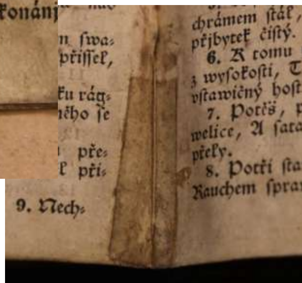
A korábbi javítás az ívközépen arra utal, hogy a kötet elején az íveket leválasztották, javították, majd visszafűzték