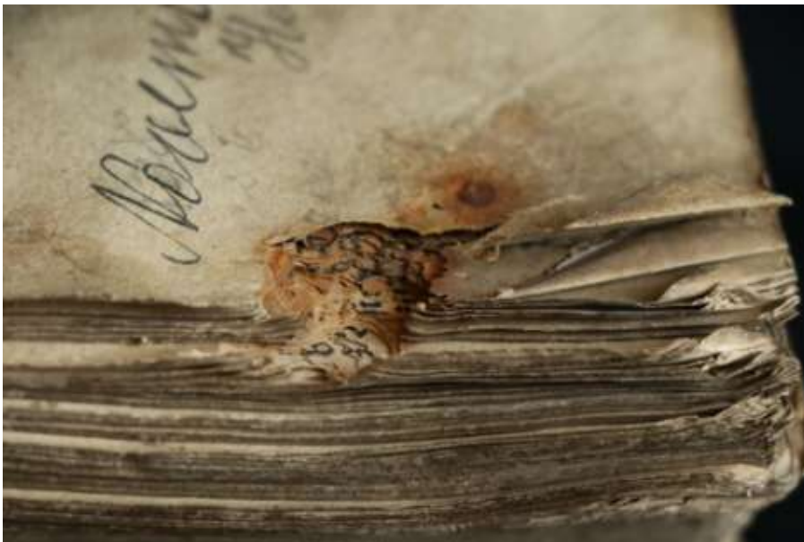
A vaskorróziótól hiányossá vált lapok