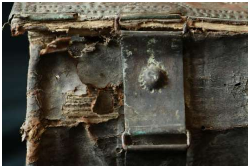
A nyílásban elszakadt gerincbőr és az töredezett sapkarész

A gerincbőr felvált a gerincről, összezsugorodott, nyílásban beszakadozott, hiányossá vált. A sapkák eltorzultak, töredezttek, sérültek.