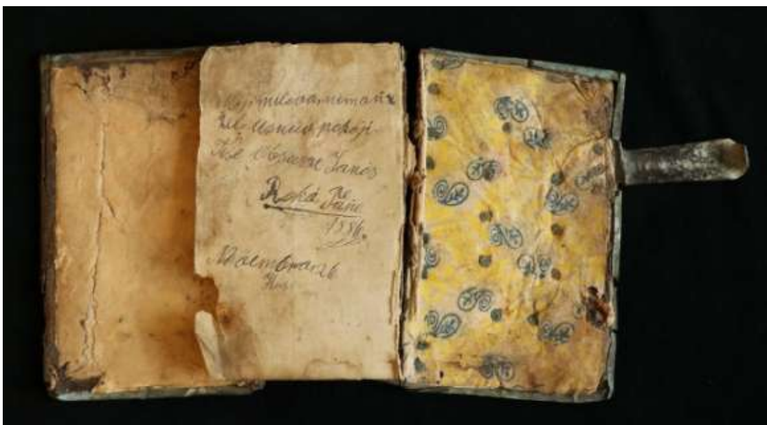
A sérült előzékek (a könyvtest kiemelése után)