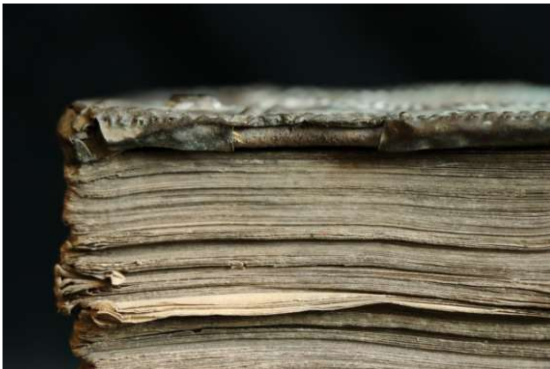
A csat akadási helyének kialakított hely letört a tábla éléről