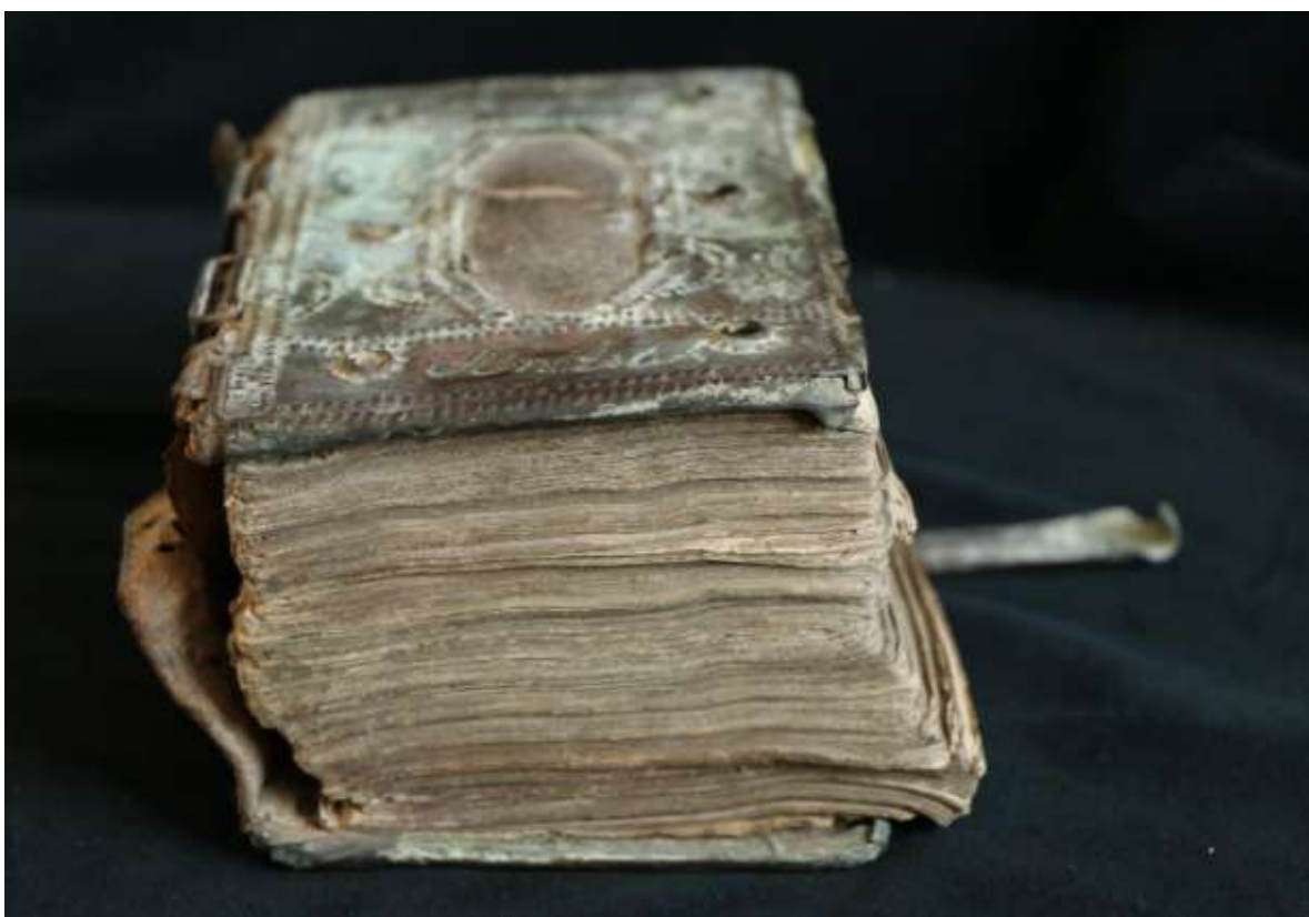
Az eldeformálódott kötet

A hiányok és a sérülések miatt a könyvtest eldeformálódott. A kötet elején az előzéktükrön penészfoltok jelentek meg, a kötet nyílása kiszakadt az előzékek szerkezete felismerhetetlenné vált.